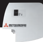
Пульт RC-E5 (опция)