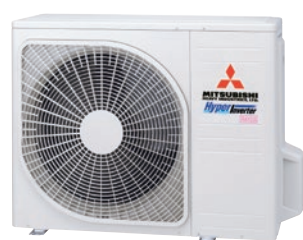
SRC40ZSX-S SRC50ZSX-S SRC60ZSX-S